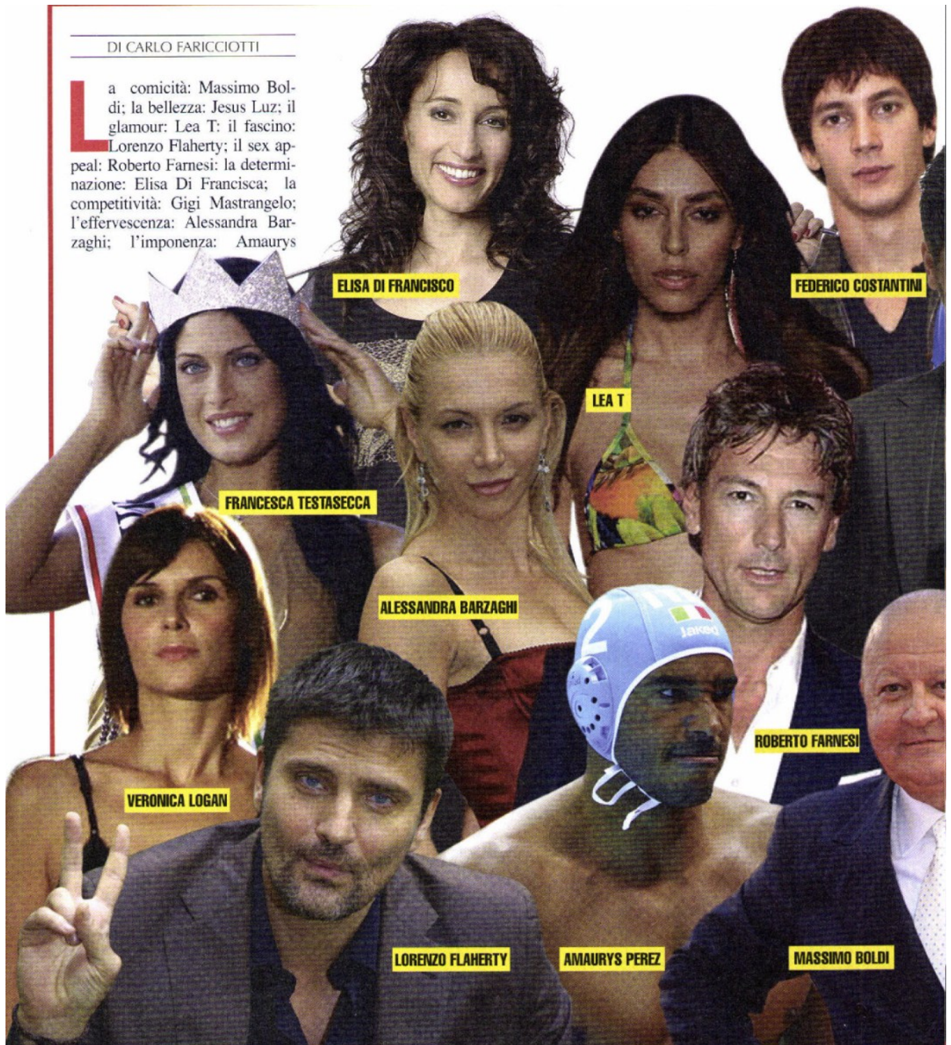
ELISA DI FRANCISCO